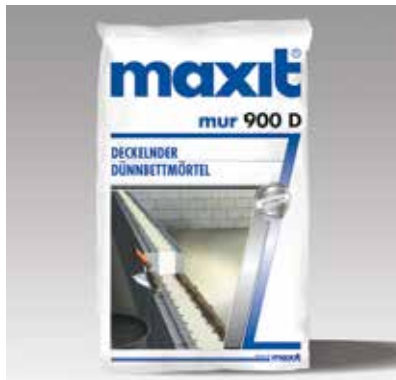
maxit mur 900 D