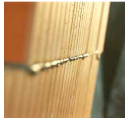
bis zu 85 % Material- einsparung