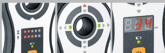
Integrierter Metall- und Spannungserkennung